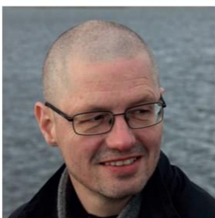
Af Bjarne W. Andresen