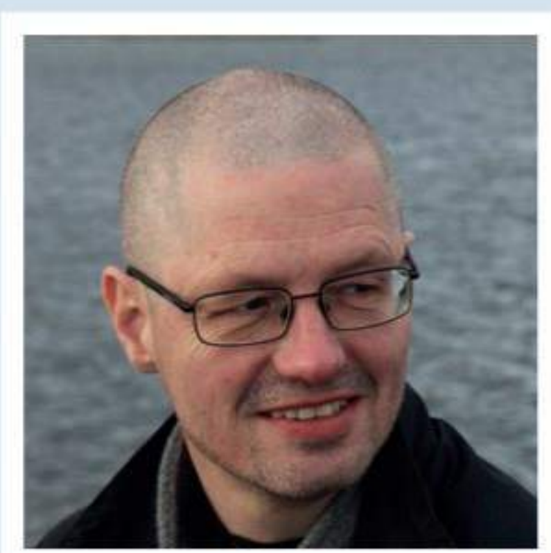
Af Bjarne W. Andresen